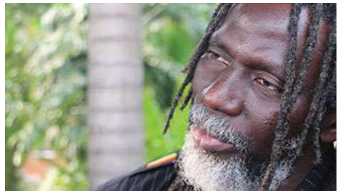
Tiken Jah Fakoly à Goma, dans l'est de la RDC, le 14 février 2015.

10 La magie du Festival Amani a une fois de plus opéré à Goma, dans l'est de la RDC. Comme lors de sa première édition, des milliers de festivaliers – environ 12 000 selon les organisateurs – sont venus bouger au rythme de la musique congolaise, rwandaise 3 , mandingue 4 , voire du hip hop ou du reggae, ce dimanche 15 février.